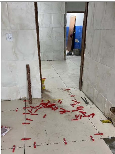
APLICAÇÃO DE REVESTIMENTO