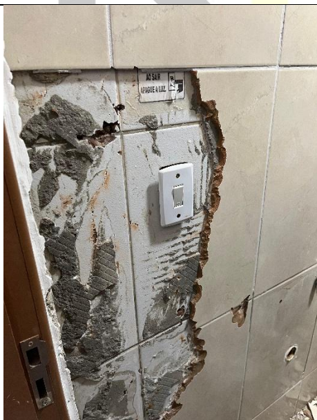
DEMOLIÇÃO DE REVESTIMENTO