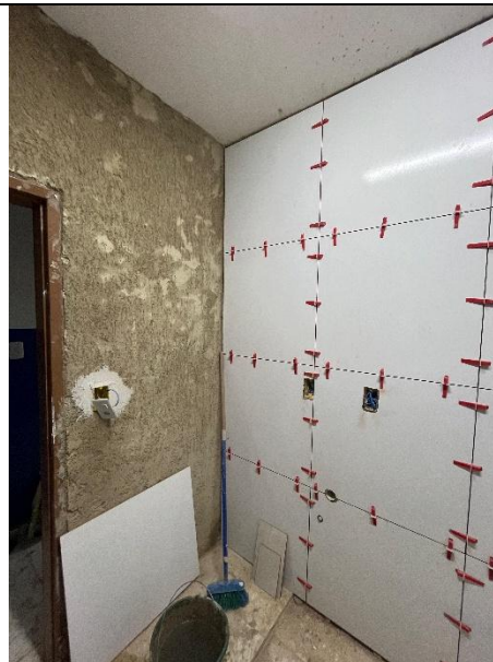
APLICAÇÃO DE REVESTIMENTO