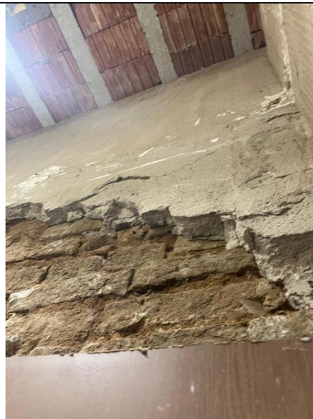
DEMOLIÇÃO DE ARGAMASSA