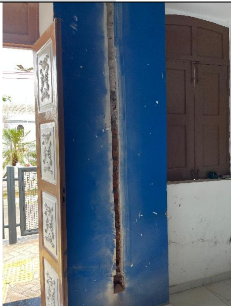
INFRA PARA INSTALAÇÕES ELÉTRICAS