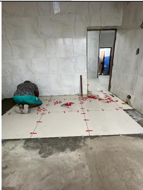
APLICAÇÃO DE REVESTIMENTO