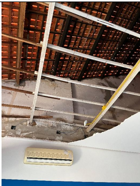
DEMOLIÇÃO DE FORRO DE GESSO